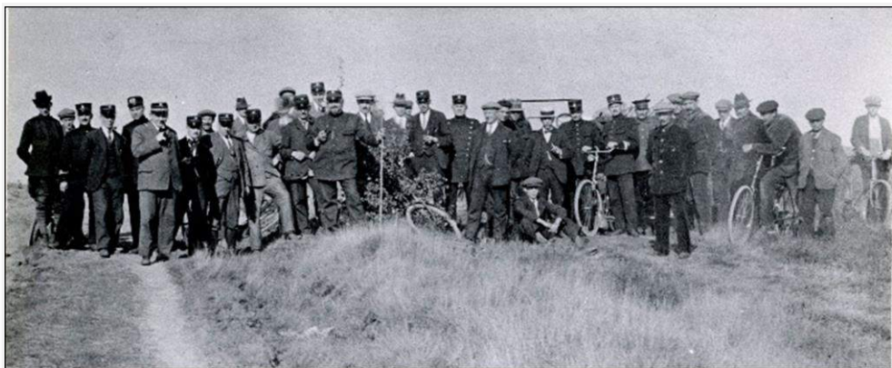
Renkum, de oprichting van de 1e Bosbrandweer in Nederland. De heren C.H. van Buuren en R. Meelker als de organisatoren. Foto mei 1925.

In 1851 bevond zich te Renkum een brandspuit in bruikbare staat met emmers, die het eigendom van de Schutterij is. Te Oosterbeek wordt