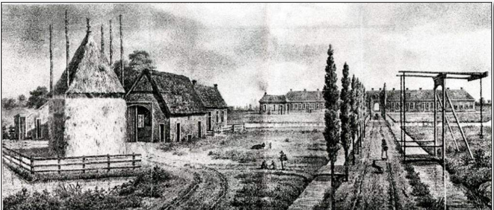
“Smakelijk eten: brood met bonken” Afbeelding 1827 van “het eerste gesticht Veenhuizen”, in artikel NRC 28-10-2016

De kolonie Veenhuizen, drie gebouwen met slaapzalen van 4,7 bij 30 meter voor steeds 80 kinderen, huisvestte tussen 1824 en 1859 in totaal zo'n 8.600 wezen, op het hoogtepunt zaten er ruim 2.000. Zij werkten voor de kost, en leerden al doende voor landarbeider, dienstmeid of, vanaf het moment dat Veenhuizen een stoomspinnerij kreeg, voor fabriekswerker. Goede bedoelingen, zou je kunnen denken, en zo begon het plan ook. Maar aan de samenstelling van