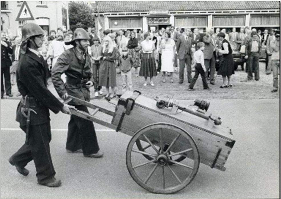
Wolfheze, viering 50 jaar Klaver bij de brandweer, receptie met o.a. oude spuitkar Foto 1981 Collectie Kees Klaver.

Toen was blijkbaar ook al sprake van brandverzekeringen: zo brengt de Oosterbeeksche Courant (OC) het volgende bericht in 1899: “Klein brandje in de “Vergulde Ploeg” een logement aan de Benedendorpsweg. Zonder hulp van de brandweer werd het brandje geblust. De verzekering dekt de schade.” En “In Renkum ontstaat brand door een petroleumtoestel van de schoenmaker B.W. v. Beukering. In korte tijd wordt het achterhuis in de as gelegd, inboedel wordt groten-