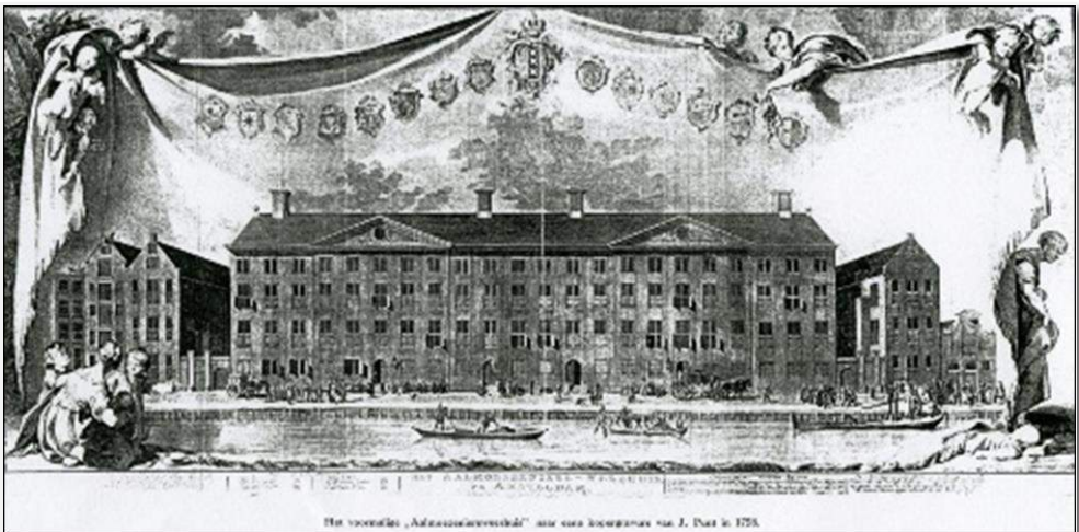
Amsterdam Aalmoezeniersweeshuis Kopergravure J Punt 1758 in W.F. van Voorst, Aalmoezeniersweeshuis en inrichting voor stads-bestedelingen 1 Januari 1666 - 1 Januari 1916 Uitgave Stadsdrukkerij Amsterdam.

“De reis zou met een beurtschip van Amsterdam over IJ en Zuiderzee naar Zwartsluis en vervolgens naar Meppel plaats hebben. Van Meppel zouden de kinderen in