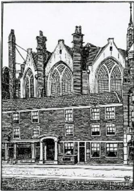
DE NIEUWE ZUDS-KAPEL

Na de alteratie van 1578 kwam de RK Kapel 'De Heilige Stede' (de heilige plaats) in protestantse handen. Zij gaven het de naam Nieuwezijdskapel. Deze was gevestigd aan het Rokin bij de Wijde Kapelsteeg. Sinds 1620 was de kapel bestemd voor Duitstalige gereformeerden. Het Almoezeniersweeshuis liet hier we-