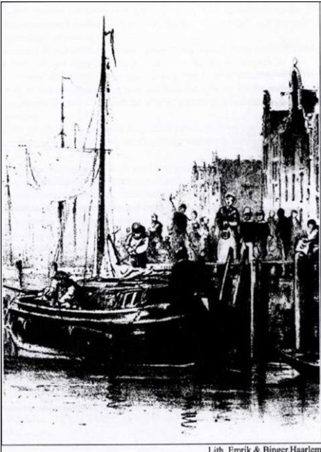
Lith. Emrik & Binger, Haarlem

"De wees van Amsterdam" boekje door M C Rudolfs uitg De Nieuwe Bibliotheek voor de Jeugd april 1993 Litho pp 29